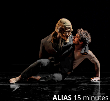
ALIAS 15 minutes