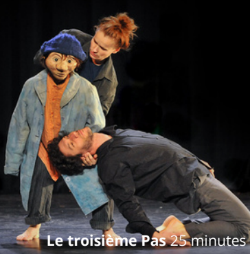
Le troisième Pas 25 minutes