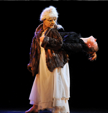
Nonna(s) don't cry 20 minutes